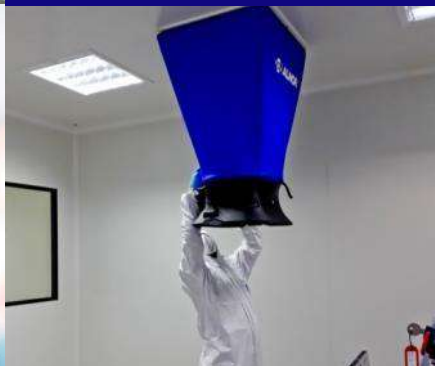
CALIFICACION Y MONITOREO